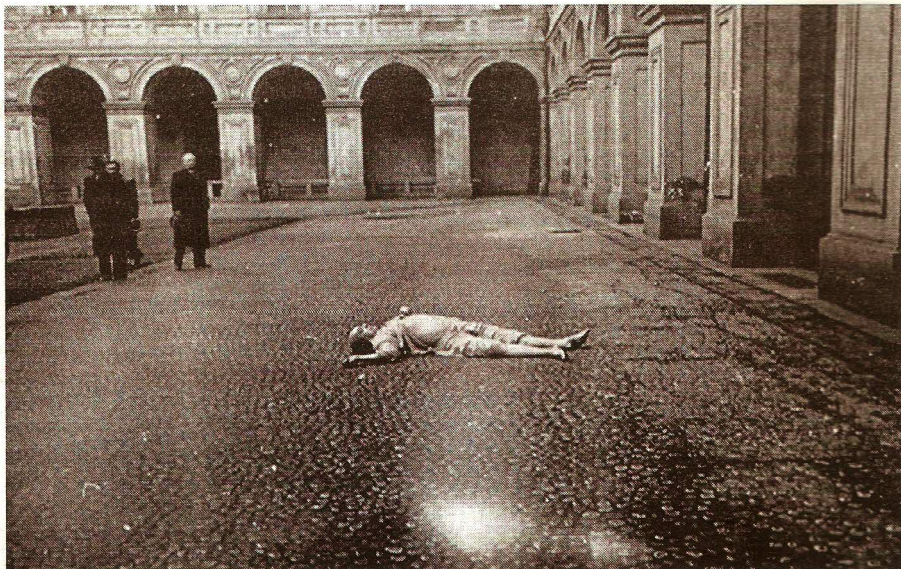
Místo činu. Masarykovo tělo ležící na nádvoří Černínského paláce. Dopadlo z okna v koupelně (spodní fotografie) opravdu takto?

Vidíte. V jeho případě se neustále tvrdí, že byl Masarykovým tajemníkem. On ale pře-